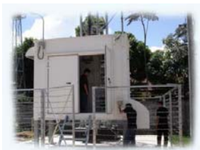
สำรวจและ ออกแบบ